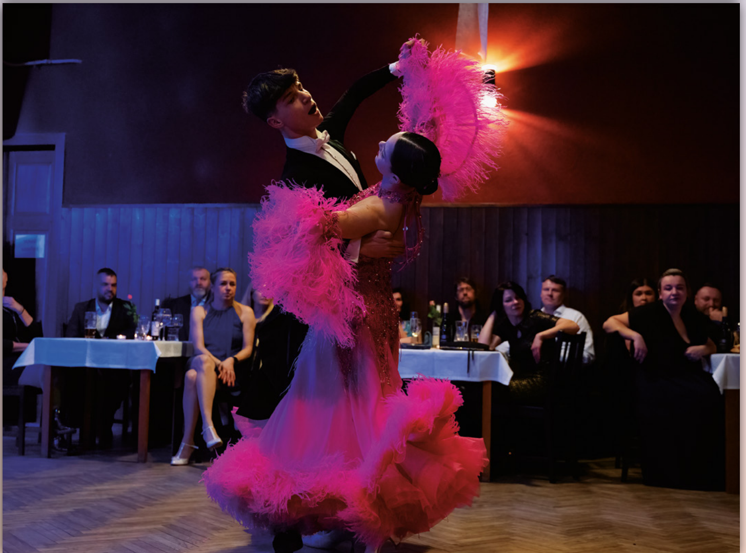
Tříkrálová sbírka, Obecní bál