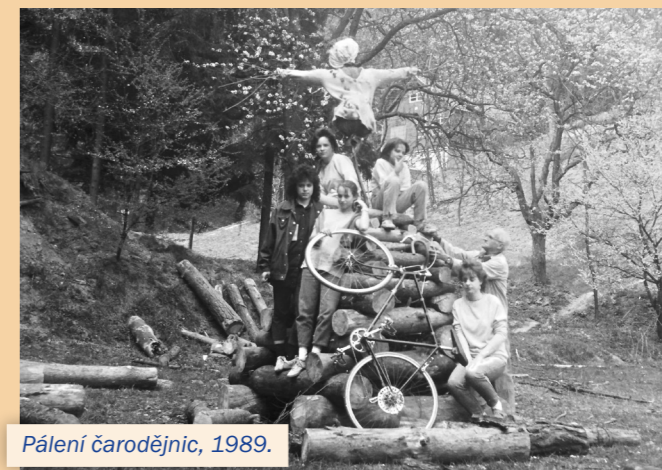
Pálení čarodějnic, 1989.

pétanque, to bylo takový hezký odpoledek. Děláváme mikulášskou besídku, buď v sále U Helánů, nebo tady na hřišti. Taky zabijačku, ale ta je spíš soukromá. Koupíme dvě půlky praseta a zpracujeme je. Když mrzne, uděláme kluziště na bruslení a na hokej.