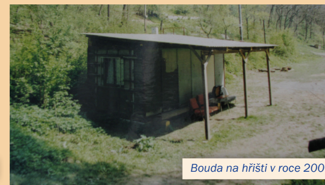
Bouda na hřišti v roce 2000.