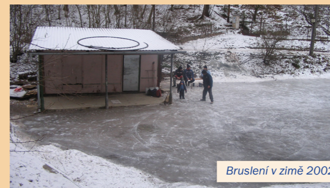
Bruslení v zimě 2002.