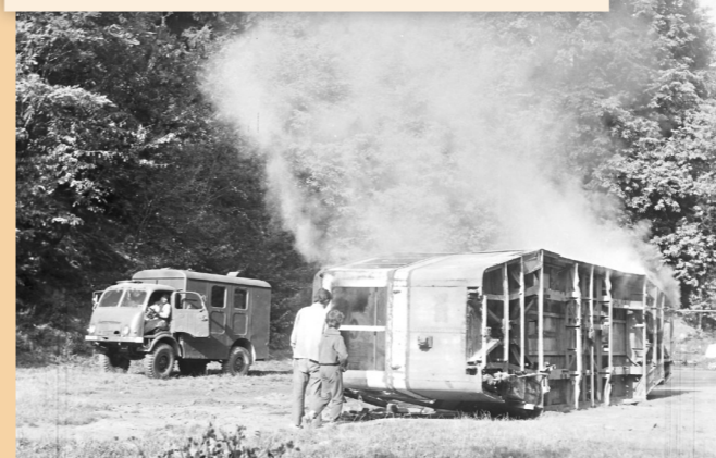
Likvidace staré „šaliny“, pravděpodobně rok 1982.

Na jaře začínáme pálením čarodějnic, naše paní potom dělají dětský den, na začátku prázdnin děláme takovou letní noc, diskotéku. Taky pořádáme fotbalový turnaj, ten bývá o Velikonocích, ale podle počasí, jenom když je na Velikonoce teplo. V říjnu zase děláme nohejbalový turnaj. Letos koncem prázdnin tady byl „festák“, ten měl velký úspěch. Nedávno tady byl turnaj