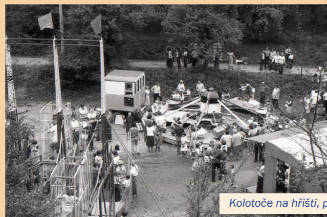
Kolotoče na hřišti, pravděpodobně rok 1981.